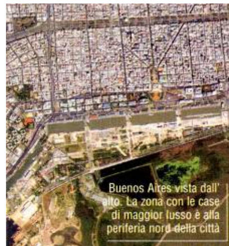
Buenos Aires vista dall'alto. La zona con le case di maggior lusso è alla periferia nord della città

Più bassi i costi se ci si sposta a Mar de Plata dove gli appartamenti viaggiano sui 600 euro al mq e il rendimento, affittandolo solo in gennaio e febbraio, è del 5 per cento. Molto interessante anche la Patagonia, con le sue località sciistiche. Nei pressi di Bariiloche, il centro più